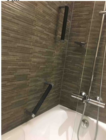
Bild 10. Flera handtag i badrummet vid badkaret skapar trygghet.