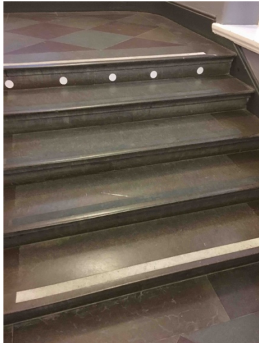
Bild 25. En stentrappa med tydliga kontrastmarkeringar vid översta trappsteget.