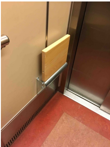
Bild 19. En nedfällbar väggstol i hissen kan vara bra om man vill vila.

Martina är i 60-årsåldern med en reumatisk sjukdom och skadade sig i trappan hemma i bostaden. Under intervjun säger hon följande: