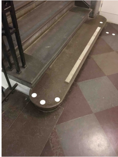
Bild 24. En stentrappa med tydliga kontrastmarkeringar vid nedersta trappsteget.