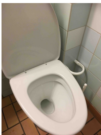
Bild 15. Toalettsitsen måste vara väl förankrad