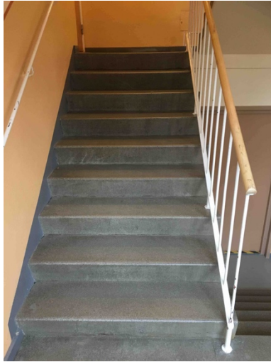
Bild 20. En bred stentrappa i ett bostadshus. Räcken finns att hålla sig i vid båda sidorna.