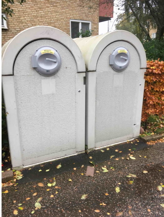
Bild 1. Höga höjder till luckorna vid sophus.

Efter skadehändelsen har hon blivit mer försiktig och medveten om riskerna i den egna boendemiljön. Hon fortsätter: "Jag går ju alltid med stavar nu för tiden på vinterhalvåret eller käpp. Och jag har alltid med mig halkskydd".