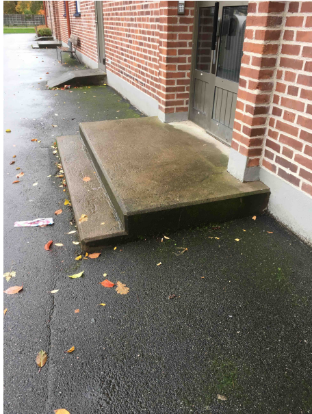
Bild 2. Stentrappor till hyreshus har olika höjd och utformning.