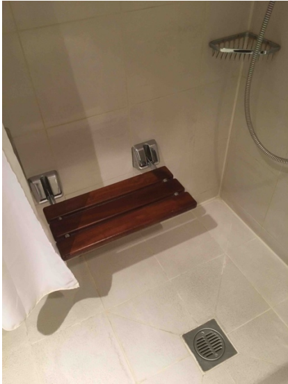
Bild 11. En nedfällbar s.k. väggstol i duschutrymme ger ökad trygghet och säkerhet.