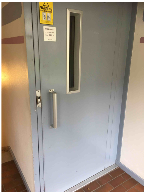
Bild 17. Äldre hiss utrustad med varningsskylt om klämskador/risk. Hissen saknar dörröppnare.

”Jag halkade nedåt. Jag bara halkade och slog i ryggen. Jag slog mig så att jag fick trappsteg i ryggen men det gick ganska bra ändå men...”