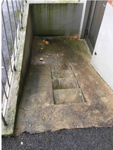
Bild 9. Smala stentrappor till källarförråd kan vara hala vintertid. Smala trappsteg och relativt långt avstånd till räcke.