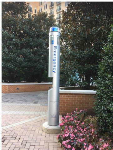
Bild 31. En alarmeringsfunktion i utemiljö (Emergency) år 2016 Washington, USA.