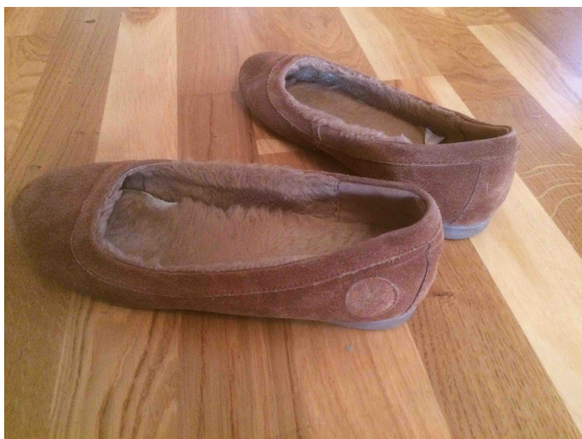
Bild 32. Innetofflor på golvunderlag skapar trygghet för flera intervjupersoner.