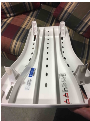
Bild 13. Sittbrädans underdel visar hur den säkert kan förankras i badkaret. Reglerbar funktion.