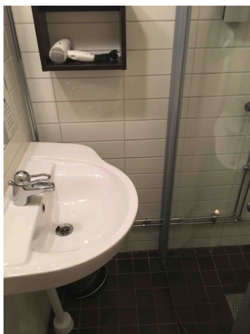
Bild 14. Utrymmen i bad- och toalettutrymme kan vara begränsande. Bilden visar ett trångt utrymme mellan handfat och en monterad duschvägg.