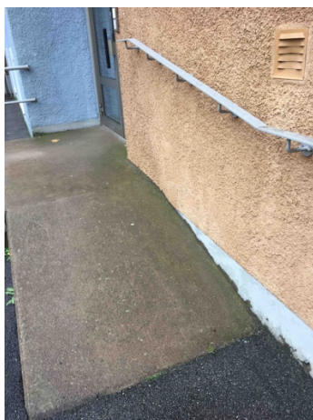
Bild 4. En murad ramp till en entré.