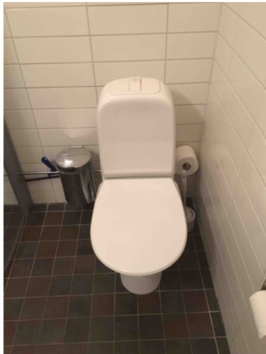
Bild 16. En del toalettutrymmen är smala och trånga.