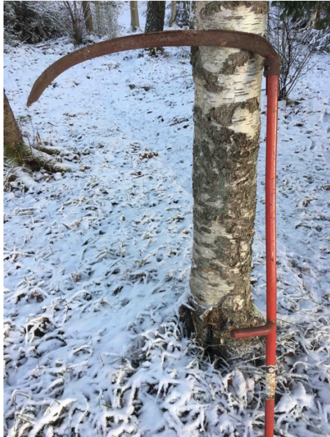
Bild 3. Lien är ett redskap som användes under sommaren. Risk för skärskador.

”Ja, det har jag. Alltså...absolut ute i vårt sommarhus har man väl skadat sig en hel del typ när man slipar lien och drar liebladet över fingrarna. Det har väl hänt någon gång så att jag fick åka ambulans. Men annars så... nej inte direkt”.