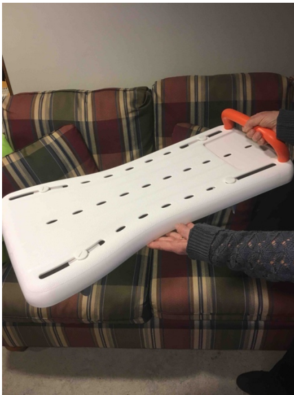
Bild 12. Praktisk sittbräda för badkar. Enkel att montera och använda.