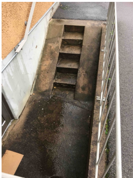
Bild 8. Smala och branta stentrappor till källarförråd försvårar tillgängligheten. I mitten finns smala trappsteg och på sidorna en stark lutning som används exempelvis för att leda en cykel.