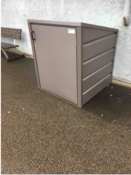
Bild 5. Förvaringsplats för utomhusrullator placerad på utsidan av ett bostadshus. Utrymmet är placerat alldeles i närheten av entrén för att öka tillgängligheten.