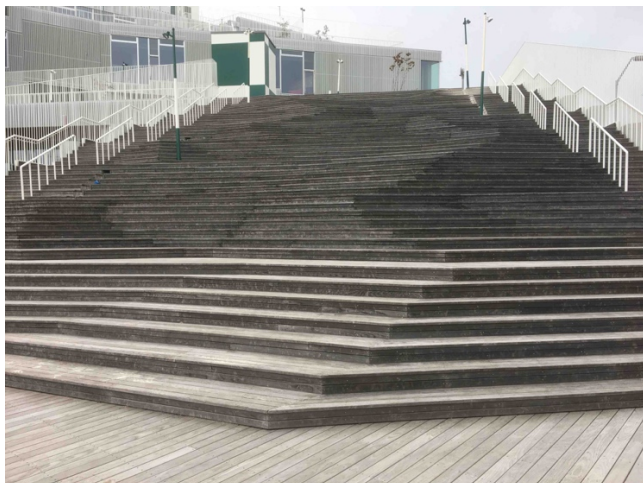
Bild 26. En nybyggd bred trätrappa i Köpenhamn år 2017.