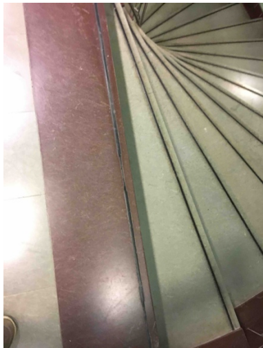
Bild 23. En stentrappa i spiralform som kan öka otryggheten. Gummilister vid trappsteg är på sina ställen utslitna.