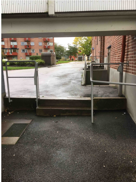
Bild 7. Stentrappor och räcken försvårar för rullstolsanvändare, rullatoranvändare och permobilanvändare att förflytta sig mellan fastigheterna.