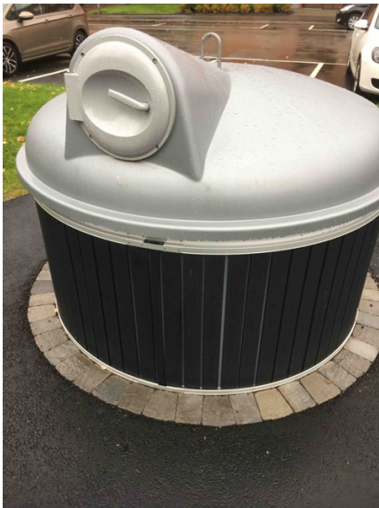
Bild 6. Lägre höjd på sophus.