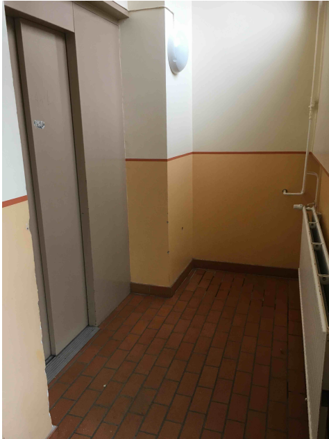
Bild 18. Nyare hiss som har automatisk dörröppnare.