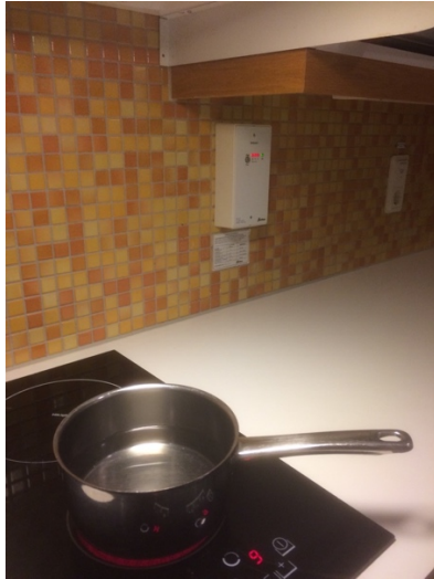
Bild 29. Spis med en induktionshäll.