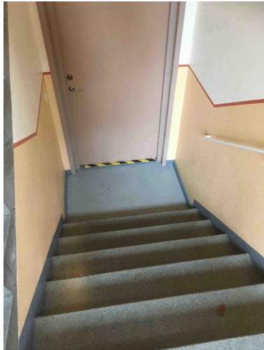
Bild 21. En stentrappa där kontrastmärkningen monterats vid dörrtröskeln. Stentrappan saknar kontrastmärkning vid samtliga steg.