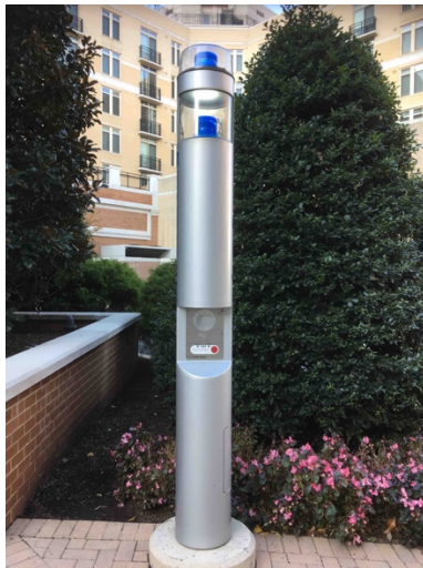
Bild 30. En alarmeringsfunktion i utemiljö (Emergency) år 2016. Washington, USA.