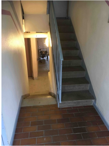
Bild 22. En smal stentrappa som kan försvåra förflyttningen avsevärt.