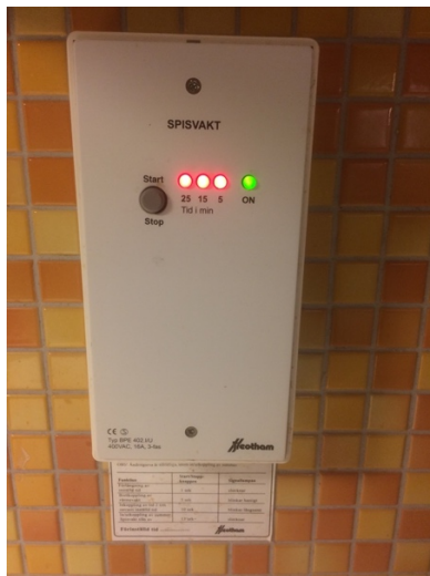
Bild 28. Installerad spisvakt som kan regleras i 5 min, 15 min respektive 25 min.

”Nej, dom har så att om man ställer in den på en viss tid och sedan om man ändrar den tiden då stänger den inte av då utan då stänger den av en dag senare. Så det finns en bugg i den. Dom som säljer dessa har väl inte tänkt. Dom är mycket dåliga. Sedan så handlar det ju om att dom också ska vara anpassade så att dom ska kunna gå att sköta när man inte ser då. Och det finns väl några olika sådana tror jag men den som jag har sett den hade de här begränsningarna med tiden. Det var nog så att när man stängde av den så stängdes den inte av utan den fortsatte att ta tiden och sådär. Det var svårt att få bort det ur den”.